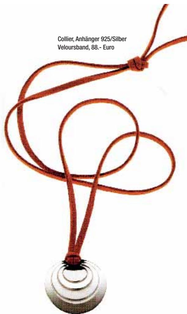
Kollier, Anhänger 925/Silber Veloursband, 88,- Euro