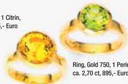
Ring, Gold 750, 1 Peridot, ca. 2,70 ct, 895,- Euro