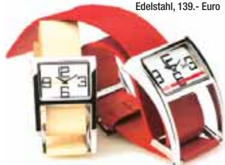
D&G Time Bay Rock Edelstahl, 139,- Euro