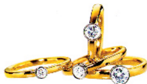
Ringe, Gold 750, je nach Brillant-Größe ab 518,- Euro