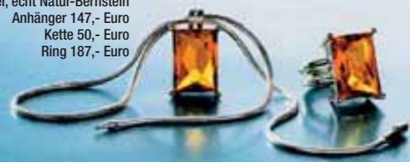
925/Silber, echt Natur-Bernstein Anhänger 147,- Euro Kette 50,- Euro Ring 187,- Euro